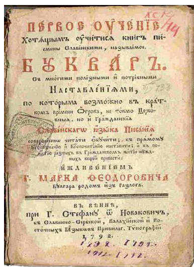
Фигура 3. Буквар с различни поучения, издаден през 1792 г. във Виена с помощта на Марко Теодорович