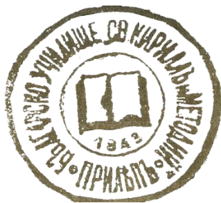
Фигура 1. Печатът на Прилепското българско училище „Св. Кирил и Методий“ – 1843 г.